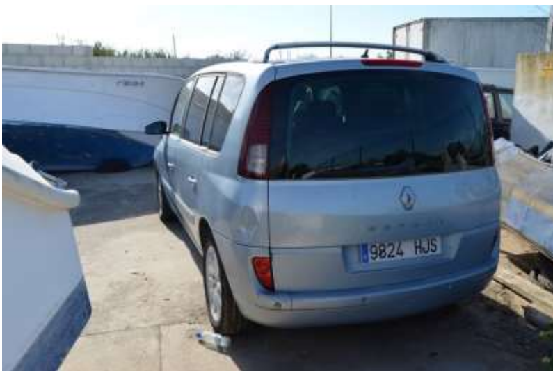
MCA 464/17 (9824-HJS)