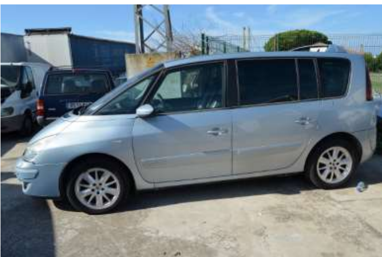
MCA 464/17 (9824-HJS)