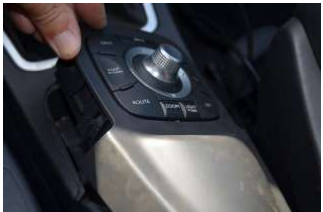
MCA 464/17 (9824-HJS)