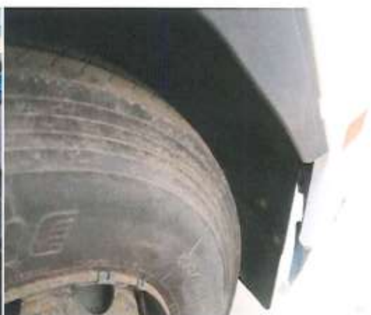
MCA 430/18 (CABEZA TRACTORA)