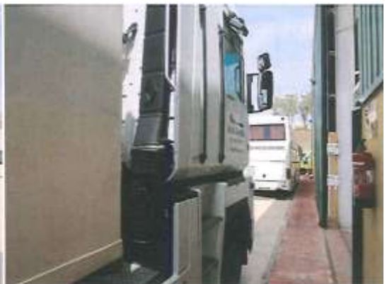
MCA 430/18 (CABEZA TRACTORA)