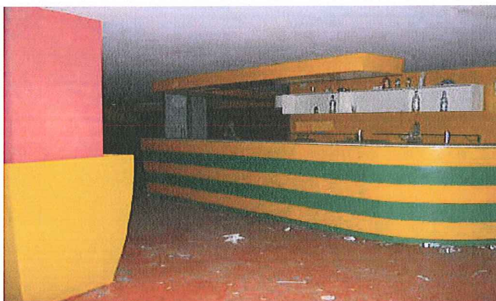
FOTO INTERIOR DE 2013