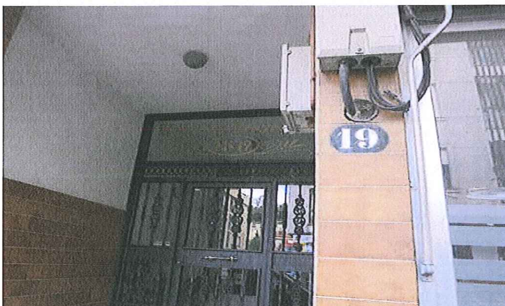
VISTA PORTAL 19