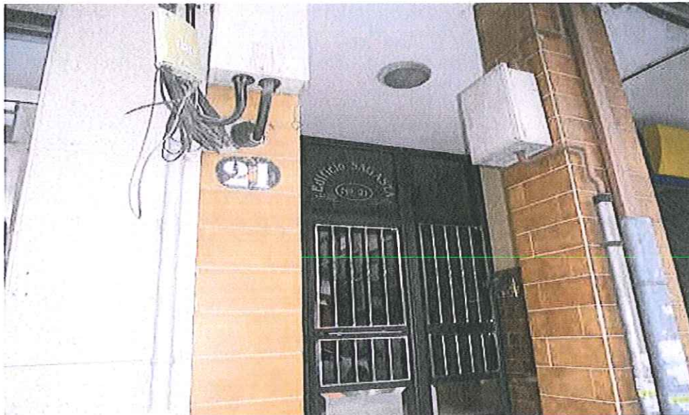
VISTA PORTAL 21