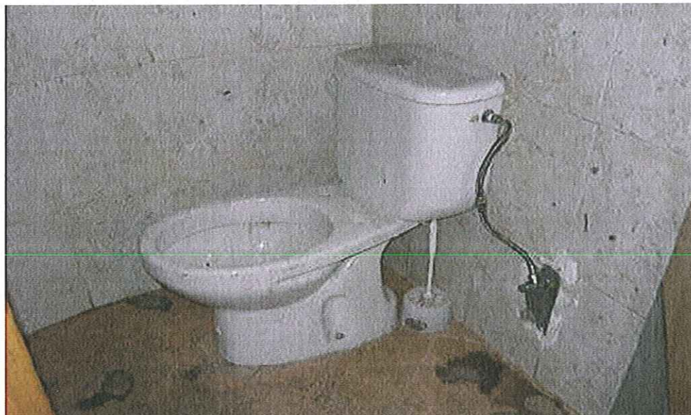
FOTO INTERIOR DE 2013