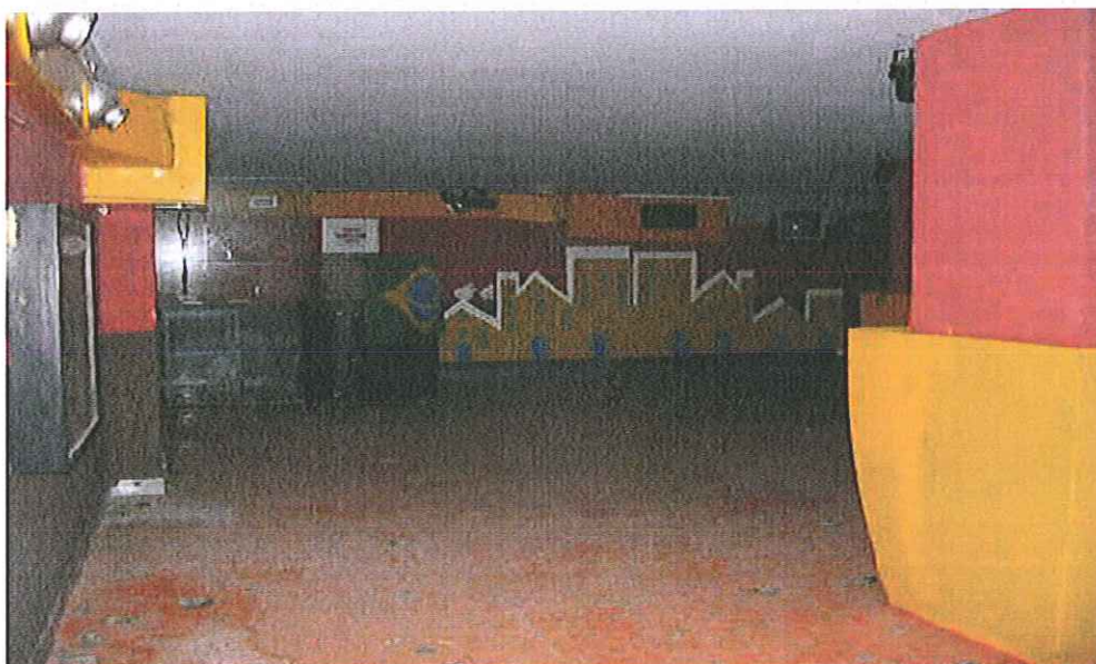
FOTO INTERIOR DE 2013