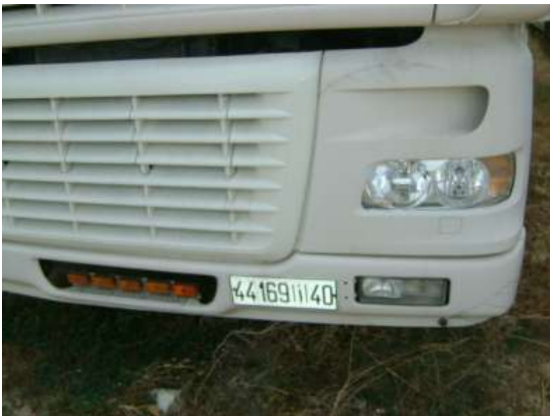
MCA 1307/16 (44169-A-40)