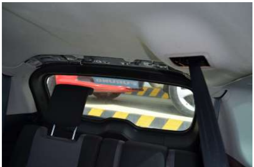
MCA 486/16 (2705-DZP)