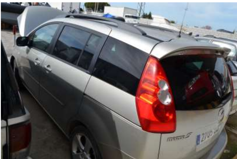
MCA 486/16 (2705-DZP)